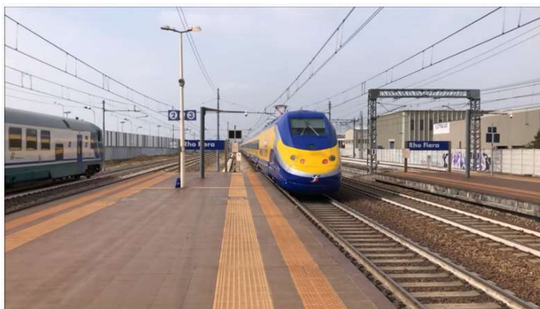
IL NUOVISSIMO DIAMANTE 2.0...

Link: https://www.youtube.com/watch?v=dt9LkmB9Vs8