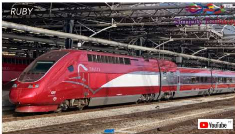
BRUXELLES-MIDI The BRAND NEW Thalys - Review of the Ruby on the inaugural trip to Paris

Link: https://www.youtube.com/watch?v=_V1dJNYt8Jc&t=33s